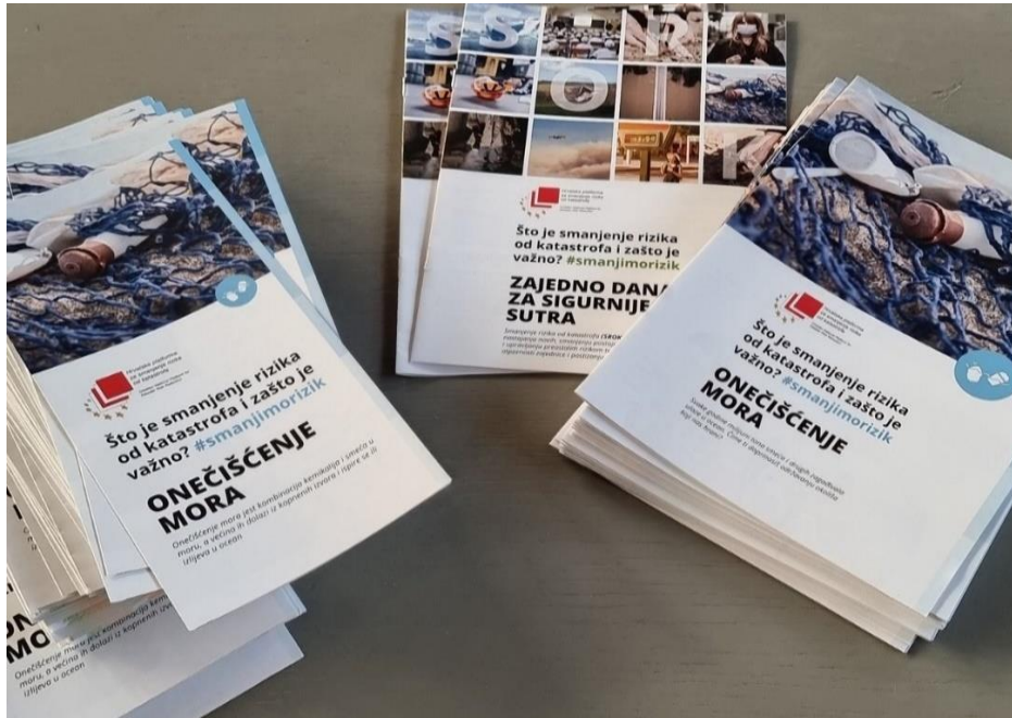
Slika broj 3